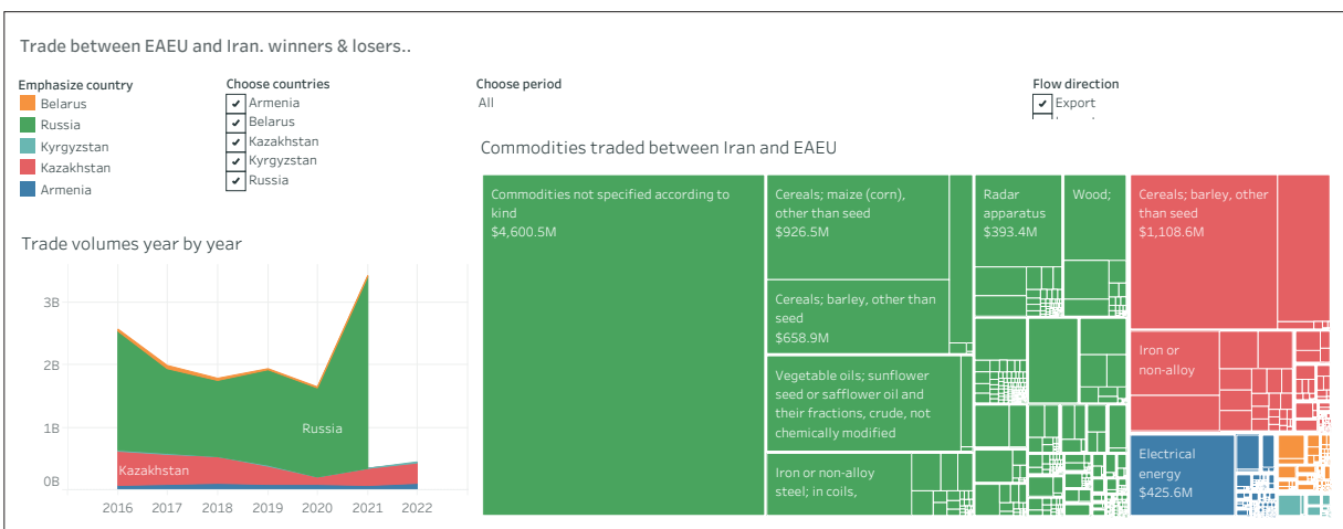
نمودار شماره (۱) صادرات ایران به کشورهای عضو اتحادیه اقتصادی اوراسیا در بازه سال‌های ۲۰۱۶-۲۰۲۲

روسیه به‌عنوان بزرگ‌ترین مقصد صادراتی ایران در میان کشورهای EAEU، نقش عمده‌ای در نمودار شماره (۱) دارد. قزاقستان