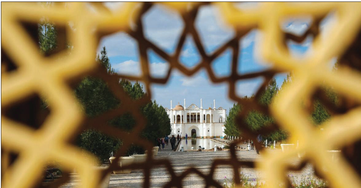
● باغ فتح آباد کرمان ●

در نتیجه، خلاقیت نقشی چندوجهی در شکل‌دهی تجربیات گردشگری در شهرها و مناطق شهری دارد؛ از بیان هنری و نوآوری‌های آشپزی گرفته تا حفظ میراث و شیوه‌های پایدار، خلاقیت به گردشگری شهری پویایی، اصالت و اعتبار می‌بخشد. همان‌طور که شهرها به‌عنوان مراکز فرهنگی و اقتصادی پر جنب و جوش به تکامل خود ادامه می‌دهند، ادغام خلاقانه هنر، فرهنگ و پایداری در جذب و سرگرم کردن مسافران از سراسر جهان ضروری خواهد بود. با پرورش خلاقیت در گردشگری، شهرها می‌توانند هویت منحصربه‌فرد خود را به نمایش بگذارند و تجربه‌های ماندگار و معناداری را برای بازدیدکنندگان ایجاد کنند و حس ارتباط و تکریم زندگی شهری را با تمام غنا و تنوع آن تقویت کنند. ♦♦