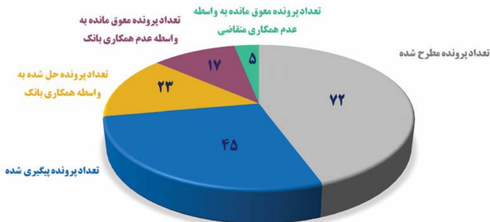
آمار کارگروه بانکی ذیل شورای گفتگوی دولت و بخش خصوصی استان کرمان در نیمه اول سال ۱۳۹۹ (۱۷ جلسه)

• تهیه و استقرار سند اجرایی توسعه فناوری و تعیین وظایف و پاسخگو بودن اجزا آن با حمایت اتاق و محوریت انجمن شرکت‌های دانش‌بنیان استان انجام شد. در این سند راهکارهای اجرایی و عملیاتی بر اساس نقاط قوت و ضعف، فرصت‌ها و تهدیدهای (SWOT) دستگاه‌های اجرائی دولتی و خصوصی ذی‌ربط در اکوسیستم فناوری دیده شده است و بر اساس SWOT اجرایی هر یک از عناصر اکوسیستم،