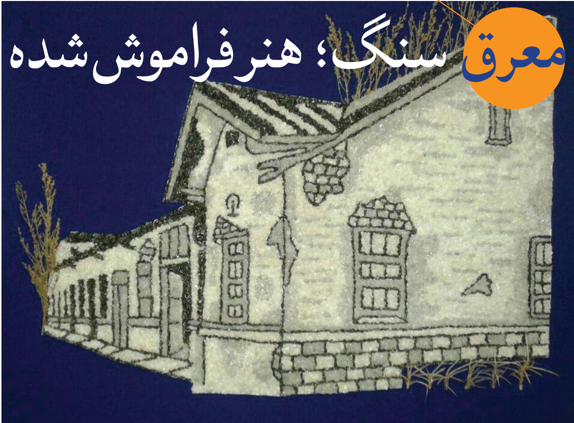
• تابلوی خانه روستایی با استفاده از سنگ‌ریزه با رنگ طبیعی