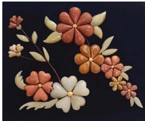
● استفاده از باطله‌های سنگ تزئینی در ساخت تابلوهای سنگی