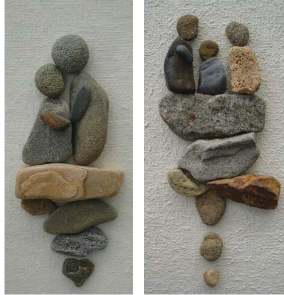
● جورچین سنگ‌های طبیعی رودخانه

هنر معرق سنگ حلقه گمشده هنر استفاده از باطله‌ها و دور ریزهای سنگ است، در این هنر تجربه اهمیت اساسی دارد و تحصیلات هنری در جایگاه بعدی است. هنر معرق، هنر جورچین است و با کمی خلاقیت می‌توان با مواد در دسترس به آثار بدیعی دست پیدا نمود. جای خالی هنر معرق سنگ در صنایع دستی معلوم است.