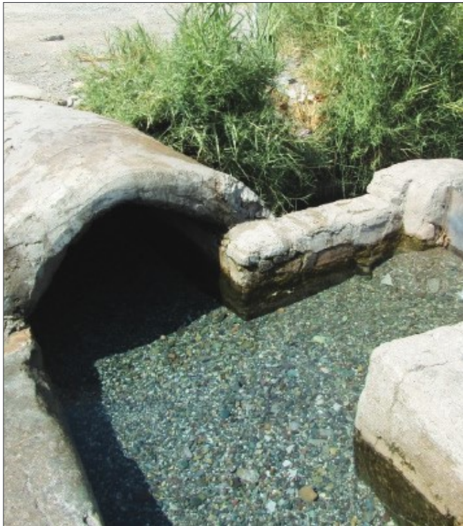
● قنات قاسم‌آباد بم ●