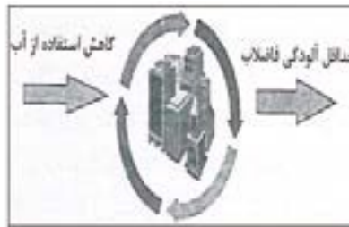
شکل شماره (۱): مدل طراحی مجدد شهرها

در زمینه رشد جمعیت سال‌های اخیر در ایران و رشد نرخ بیکاری، می‌توان بیان داشت که نرخ‌های بالای رشد جمعیت، تأثیر زیادی در افزایش مصرف می‌گذارد. از این نظر، دیدگاه افزایش تقاضا نیز به علت کمبود سرمایه و محدودیت‌های رشد، نمی‌تواند موجب ایجاد انگیزه برای افزایش تولید ملی شود.