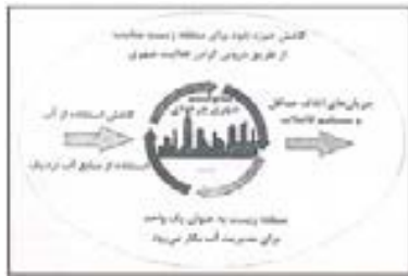
شکل شماره (۲): مدل شهری خوداتکا