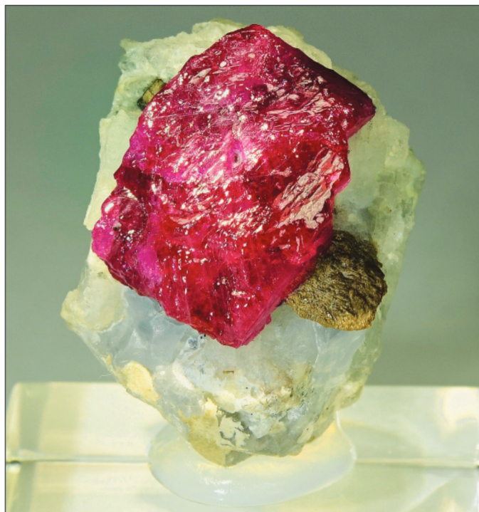
● باقوت معدنی موکوک میاهار

در حوزه شناسایی آثار معدنی و ذخایر اقدامات زیادی انجام شده است. امروز حتی اگر از اتاق بازرگانی یا سازمان صمت پرسیده شود چه اقدامی انجام شده و آیا نقشه راه وجود دارد، پاسخ مثبت است، اما آیا عملیاتی شده است؟ خیر؛ برای مثال در موضوع استخراج سنگ‌های قیمتی هنوز دستورالعمل مدونی وجود ندارد. سازمان نظام‌مهندسی در استان کرمان یک دستورالعمل برای مطالعه سنگ‌های قیمتی دارد، اما وقتی که مطابق با دستورالعمل جلو می‌رویم در نهایت چیزی دستگیرمان نمی‌شود. نویسندگان دستورالعمل با دیدگاه معدنی به بحث اکتشافات گوهرسنگ‌های قیمتی پرداخته‌اند. این قبیل سنگ‌ها در مقیاس گرم و قیراط ارزشمند هستند. فرض نخست این است که دستورالعمل خوب تهیه شده است و کارشناسان مرتبط در این موضوعات قوی نیستند و اطلاعات کافی در این زمینه ندارند و فرض دوم این است که دستورالعمل کاربردی نیست. تاکنون ندیدم که در این مورد تحقیق شود و زوایای پنهان این دستورالعمل‌ها