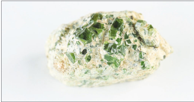
● همان‌نویید، باغ برج ●