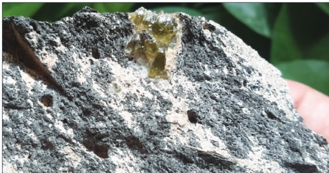
● زبرجد در سنگ میزبان قلعه حسنعلی راین ●