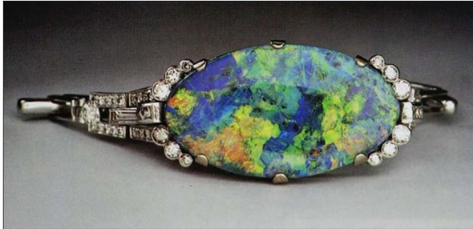
● اوپال ●