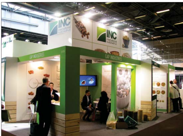
◀ غرفه‌ی سازمان جهانی خشکبار (INC) روبروی غرفه‌ی انجمن خرما در نمایشگاه «سیال» فرانسه، ۲۰۱۲