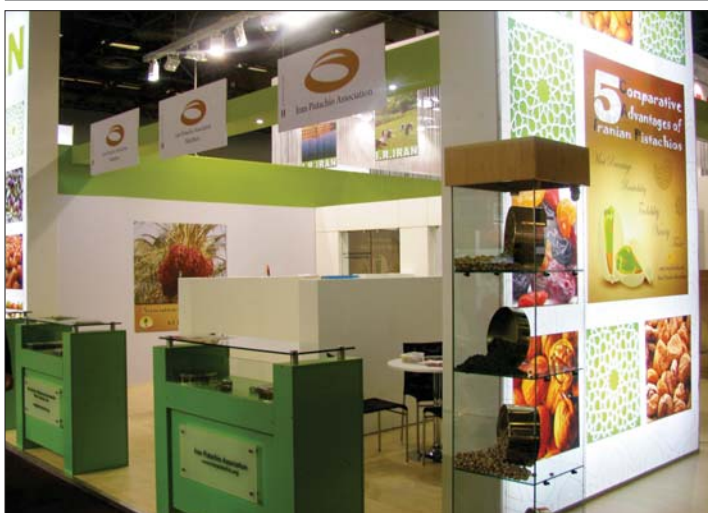
◀ غرفه‌ی انجمن خرما و پسته در نمایشگاه «سیال» فرانسه، ۲۰۱۲