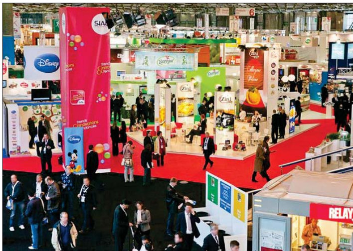
◀ نمایشگاه مواد غذایی «سیال» فرانسه، ۲۰۱۲